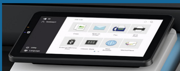
Nouvel écran tactile 10,1 pouces avec feedback par vibrations