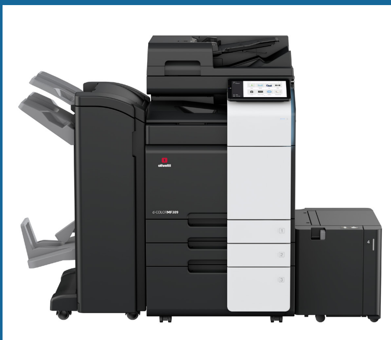
d-Color MF309 équipé DF-714 + PC-416 + LU-302 + RU-513 + FS-536SD